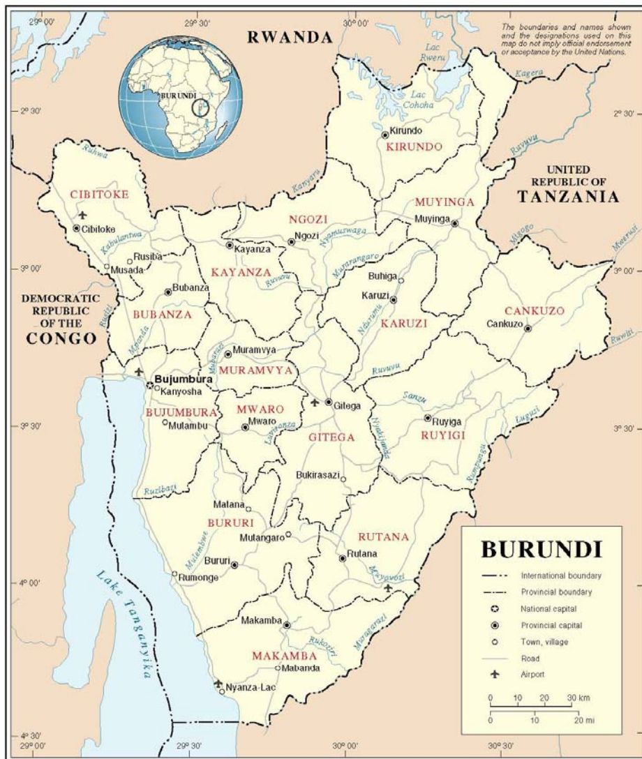
Map No. 3753 Rev. 5 UNITED NATIONS March 2004